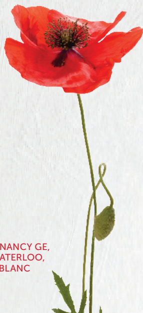
ILLUSTRATION DE LA PAGE DE COUVERTURE PROVENANT DE NANCY GE, ÉCOLE SECONDAIRE LAUREL HEIGHTS, FILIALE 05-530 DE WATERLOO, SOUMISSION POUR LA CATÉGORIE AFFICHE EN NOIR ET BLANC

As we that are left grow old: Age shall not weary them, Nor the years condemn. At the going down of the sun And in the morning, We will remember them.